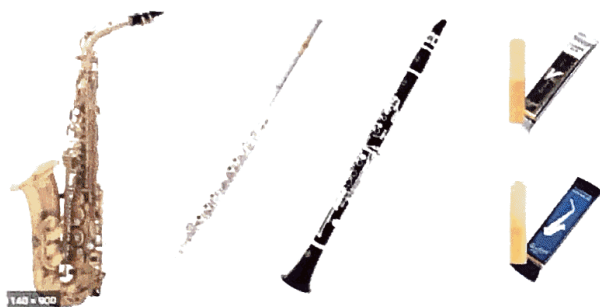
Saxophone, Flute traversière, Clarinette

Ventes d'Anches (à prix coutant) pour les saxophones et les clarinettes.